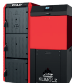
NG Zasobnik 300 l z systemem komfortowego otwierania.