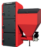
EKO 320 Zasobnik 320 l z systemem komfortowego otwierania.