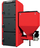
EKO 190 Zasobnik 190 l